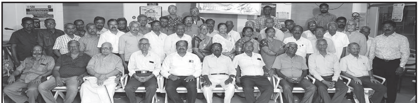
Nagapattinam Pensioners Meet