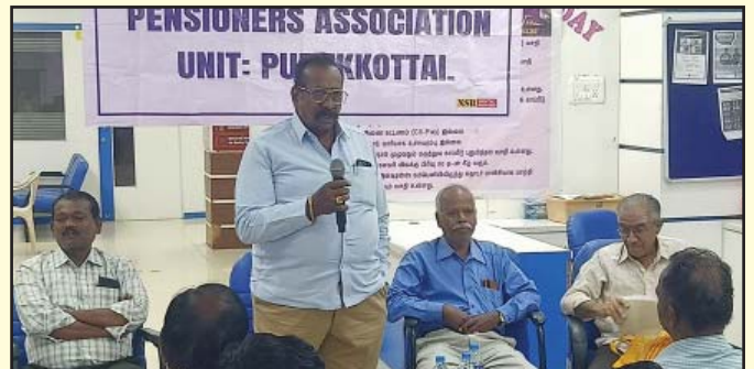
Pensioners Meet held at our Pudukottai Unit