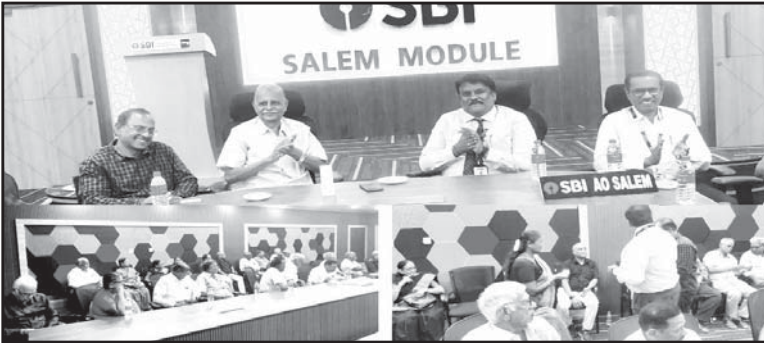
Special Camp by Salem Unit for Pensioners ID Card