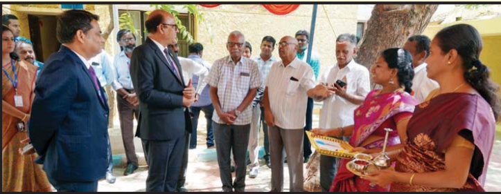
Inauguration of Madurai Dispensary in a New premises by the General Manager - NW II, in Madurai AO