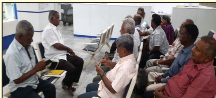
Namakkal Area Meeting